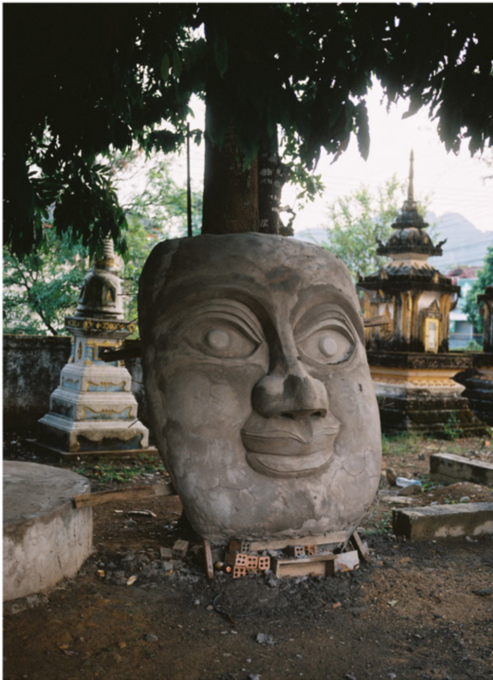
Statue de Boudha en-cours de construction.