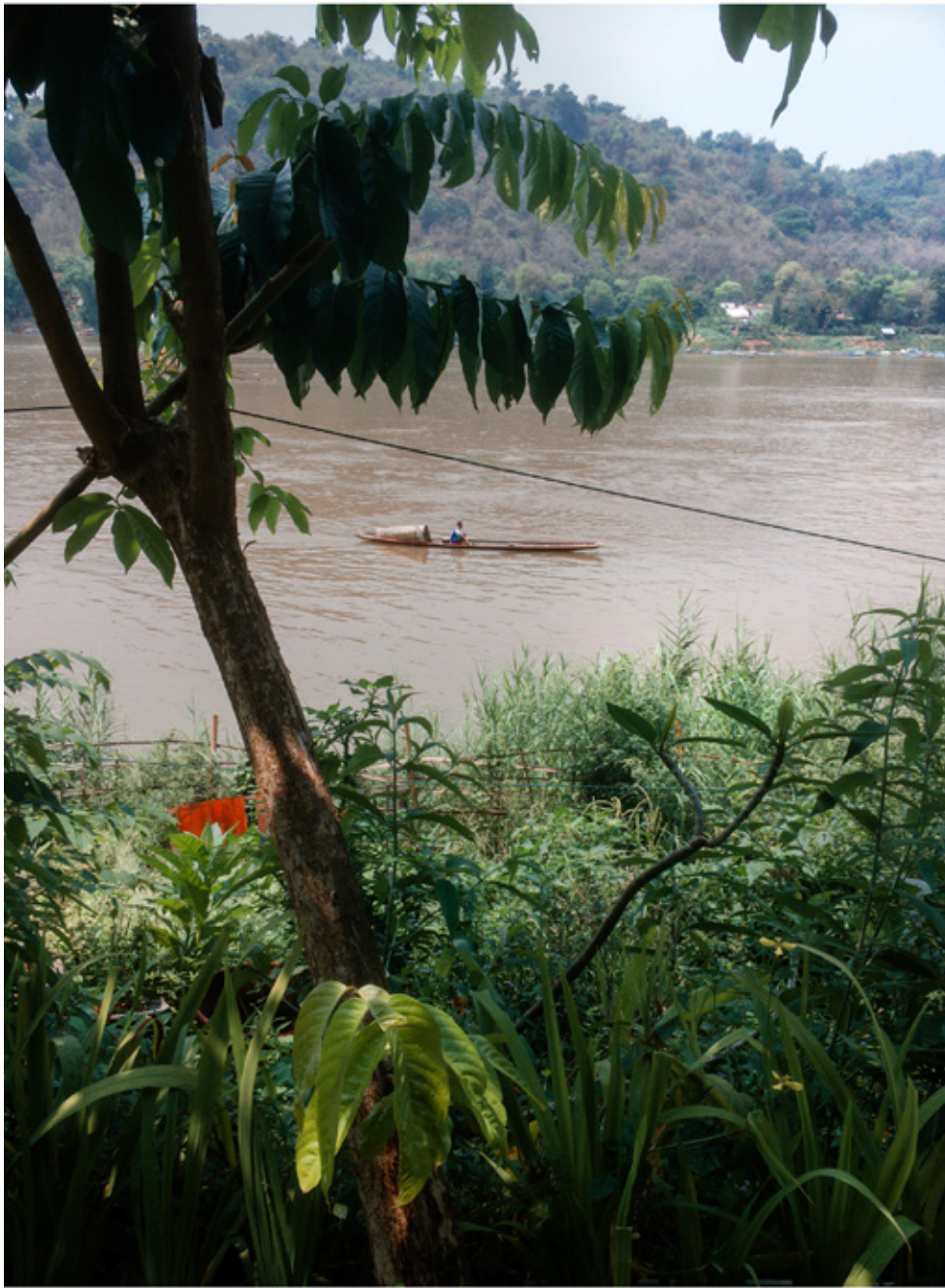
Le Mékong, juste avant sa rencontre avant le Nam Ou.