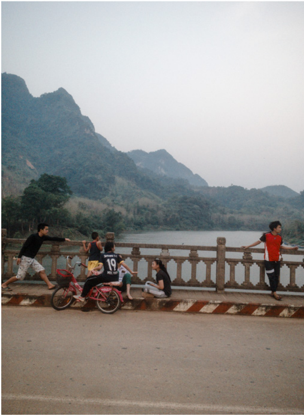
Il est 6h, c'est la fin de la journée. Leur travail terminé, les jeunes viennent profiter de la douceur du soir sur le pont immense qui surplombe le Nam Ou.