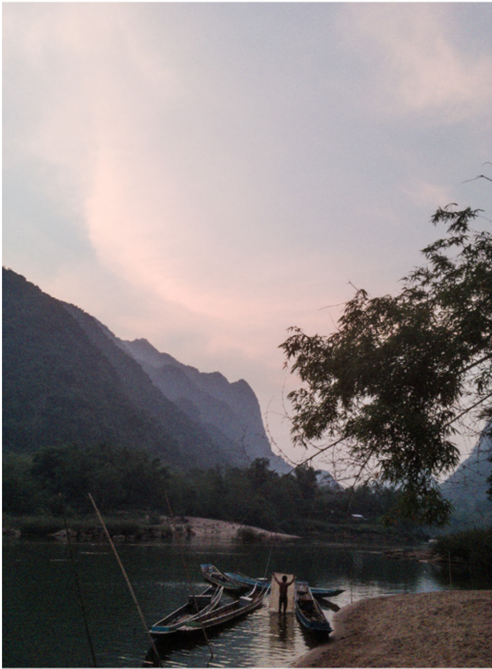
Pêcheurs sur La Nam Ou à Muang Noy.