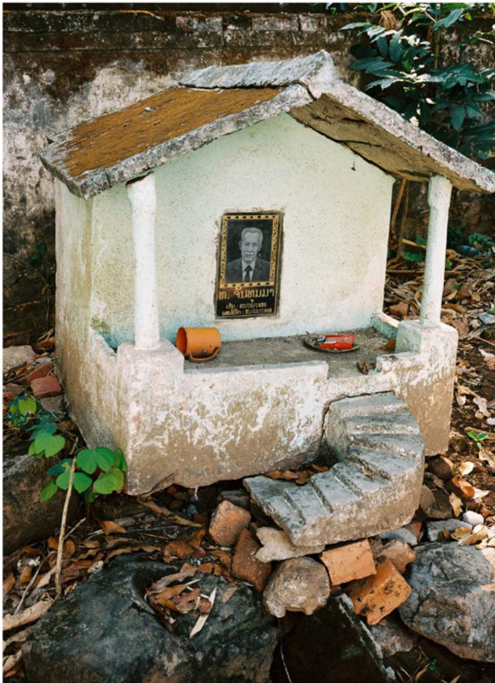
Petite sépulture dans les jardins du wat Longkhun, Luang Prabang.