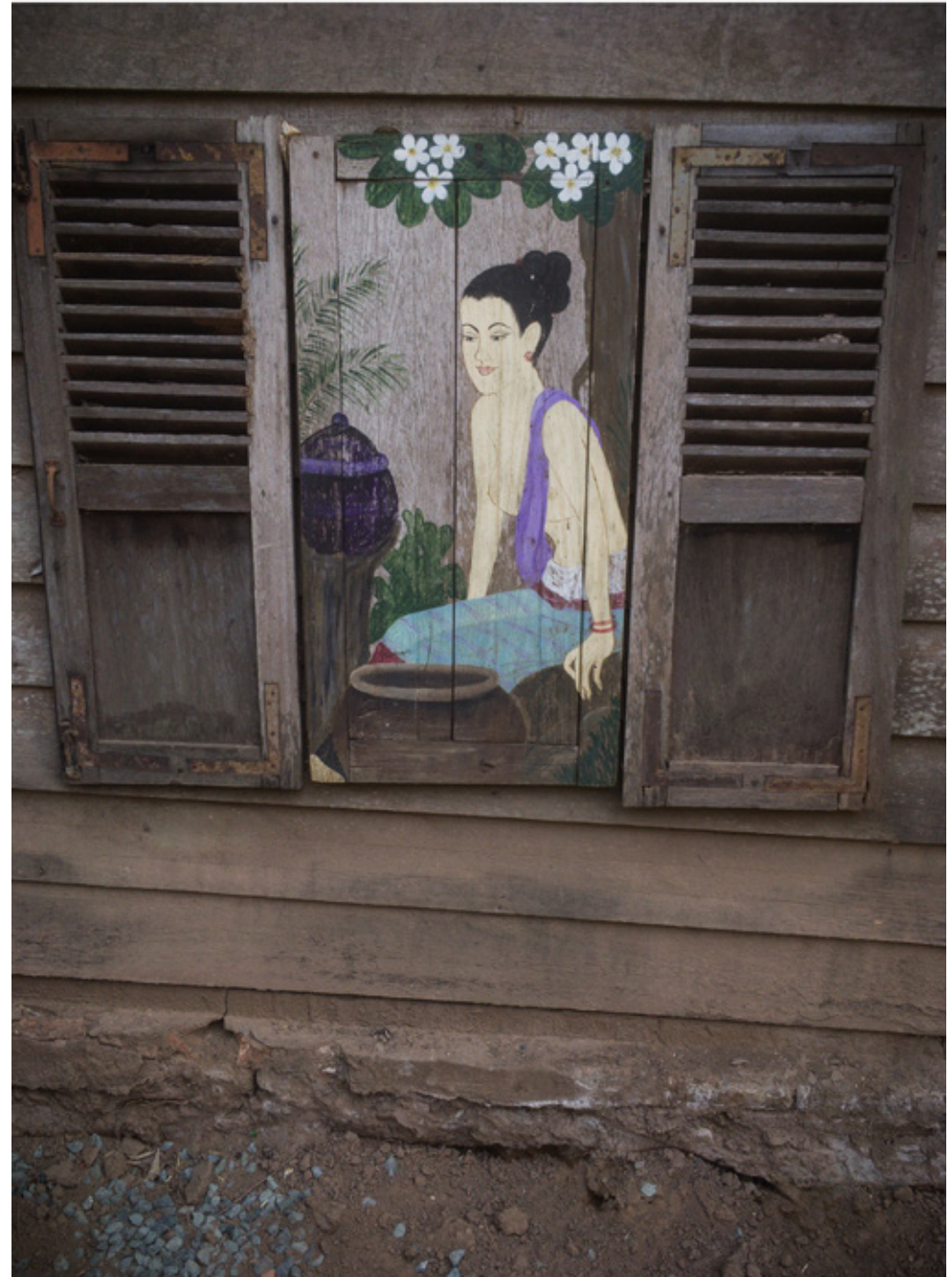
Maison traditionnelle Lao. Luang Prabang.