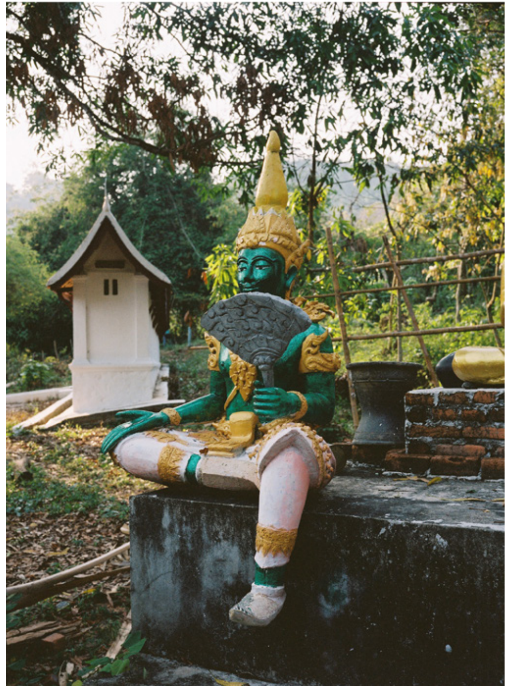
Luang Prabang abrite pas moins de 80 temples. De l'autre côté du fleuve, le wat Longkhun.