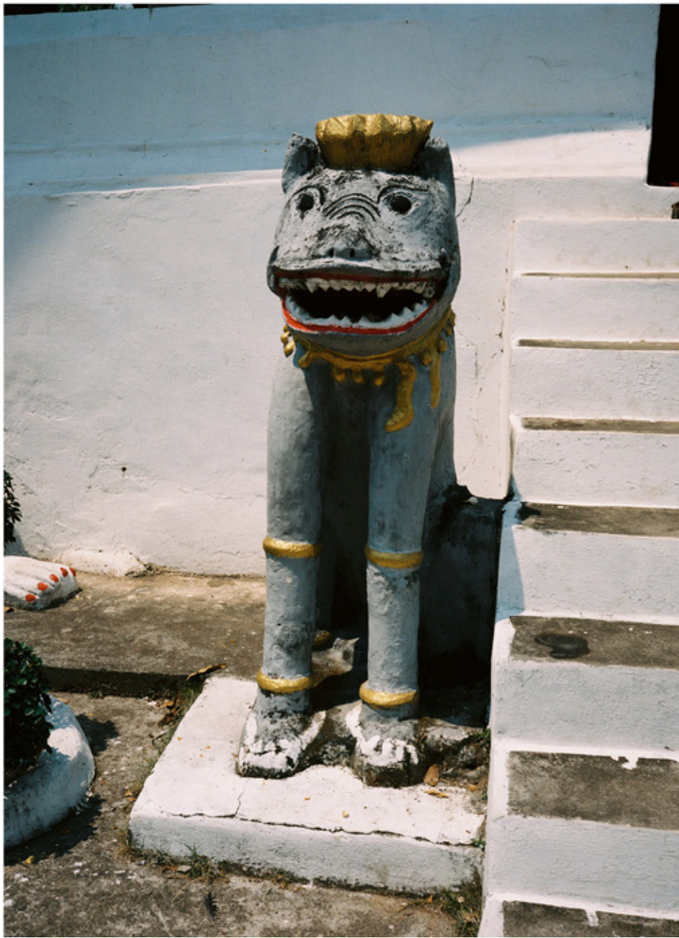
Gardien féroce à l'entrée d'un wat (temple), Luang Prabang.