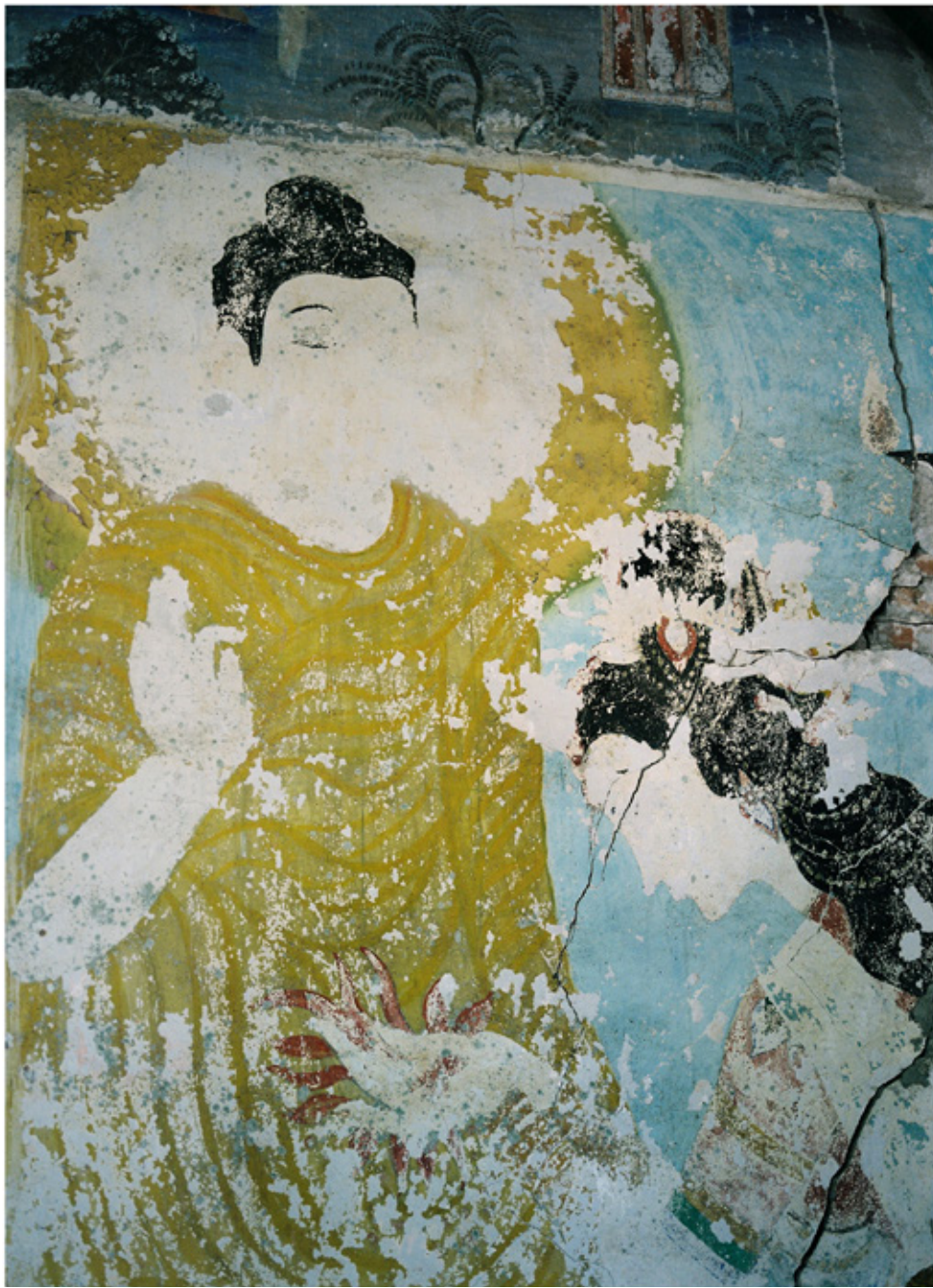
Le pays, de tradition bouddhisme The-ravada, compte environ 5000 temples, la tradition religieuse reste forte dans les zones rurales. Wat Had Siaw, Luang Prabang.