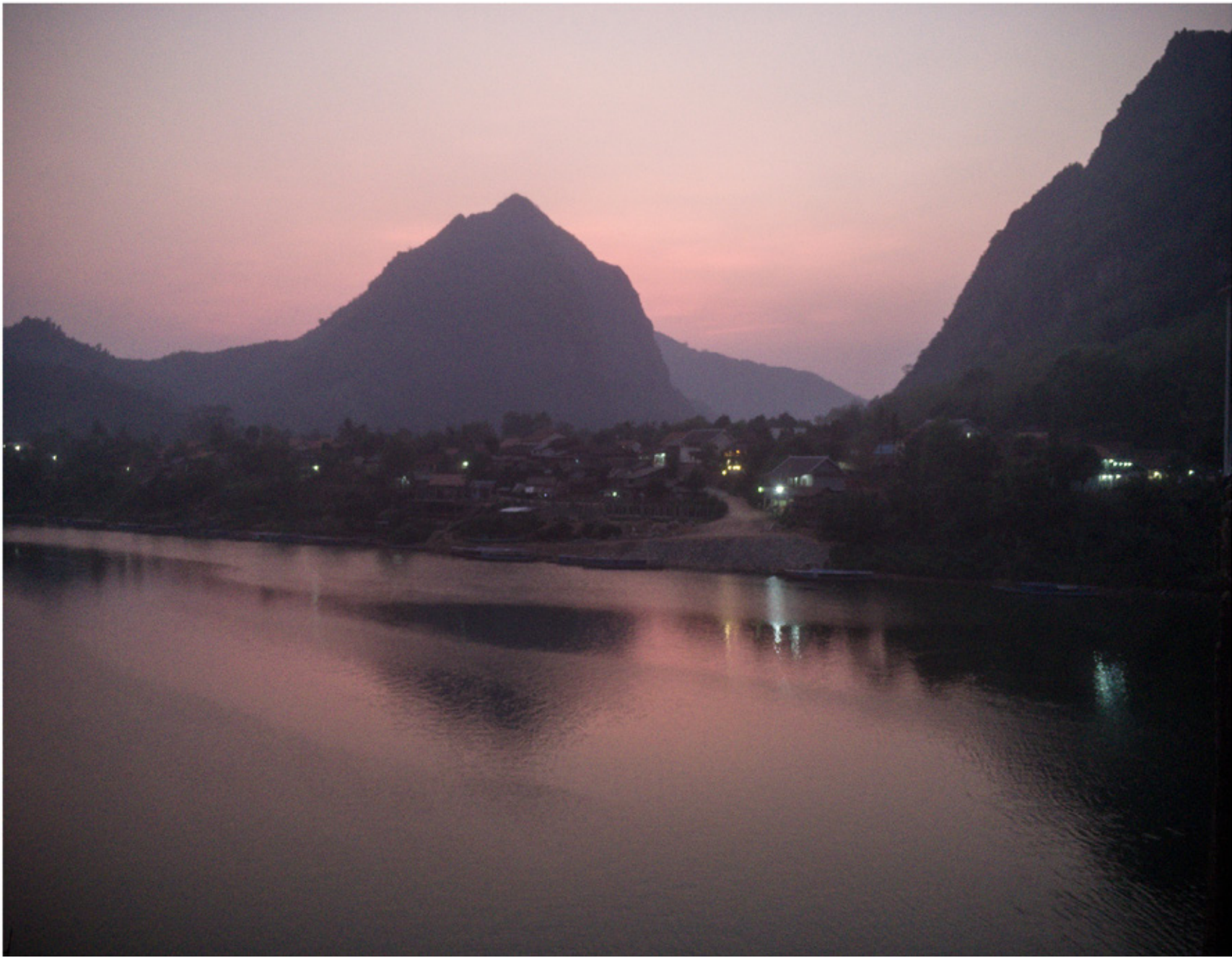
Nong KHiaw sur la Nam Ou.