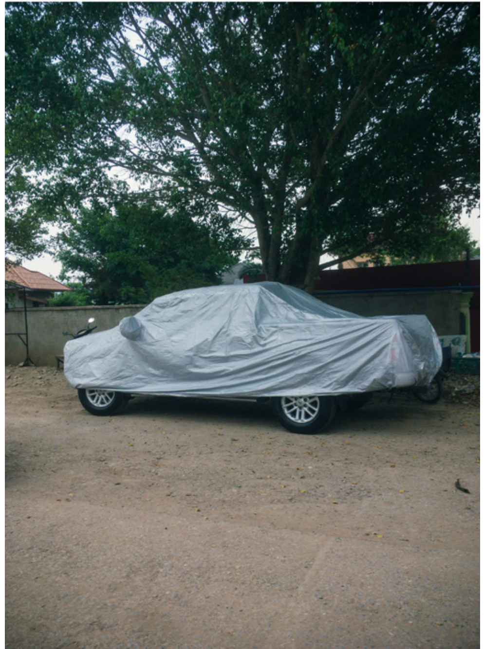
Une voiture, comme signe de richesse, de réussite sociale.