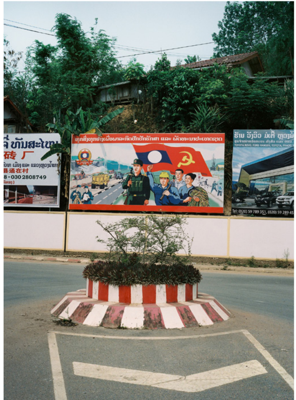
Luang Namtha, une ville proche de la frontière chinoise au Nord-ouest du Laos.