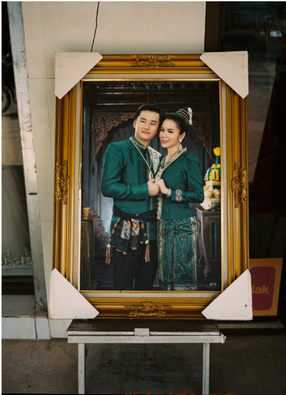
Portrait de mariés.