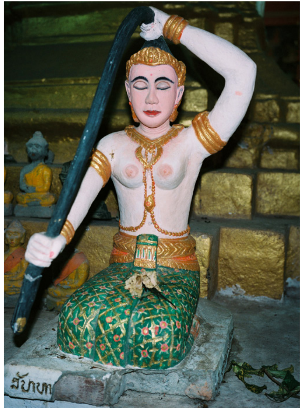
La Déesse de la Terre, Phra MaeThorani, joua un rôle clef dans l'histoire de la vie du Bouddha Les Laos la vénère pour réussir à avoir des enfants ou avoir une bonne récolte pour un agriculteur. Elle est la déesse

de la terre et des moissons, elle garantit la fertilité.