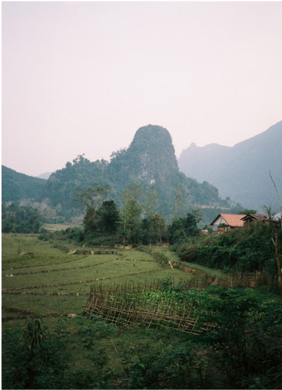
Aux alentours de Muang Noy. Les montagnes et les plateaux occupent plus de 70% du Pays. 65% de la population est rurale.