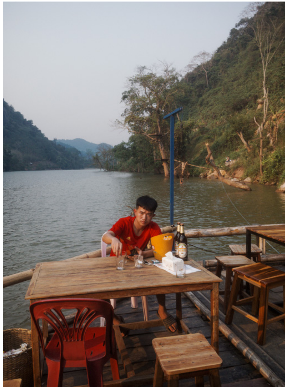
Fin de journée sur la Nam Ou à Nong Kiaw.

de la pierre, de la forêt. Bien que cette pratique soit proscrite par l'état, elle cohabite parfaitement avec le bouddhisme. Chaque village, mais aussi chaque province, possède ses génies protecteurs, les lokapâlas.