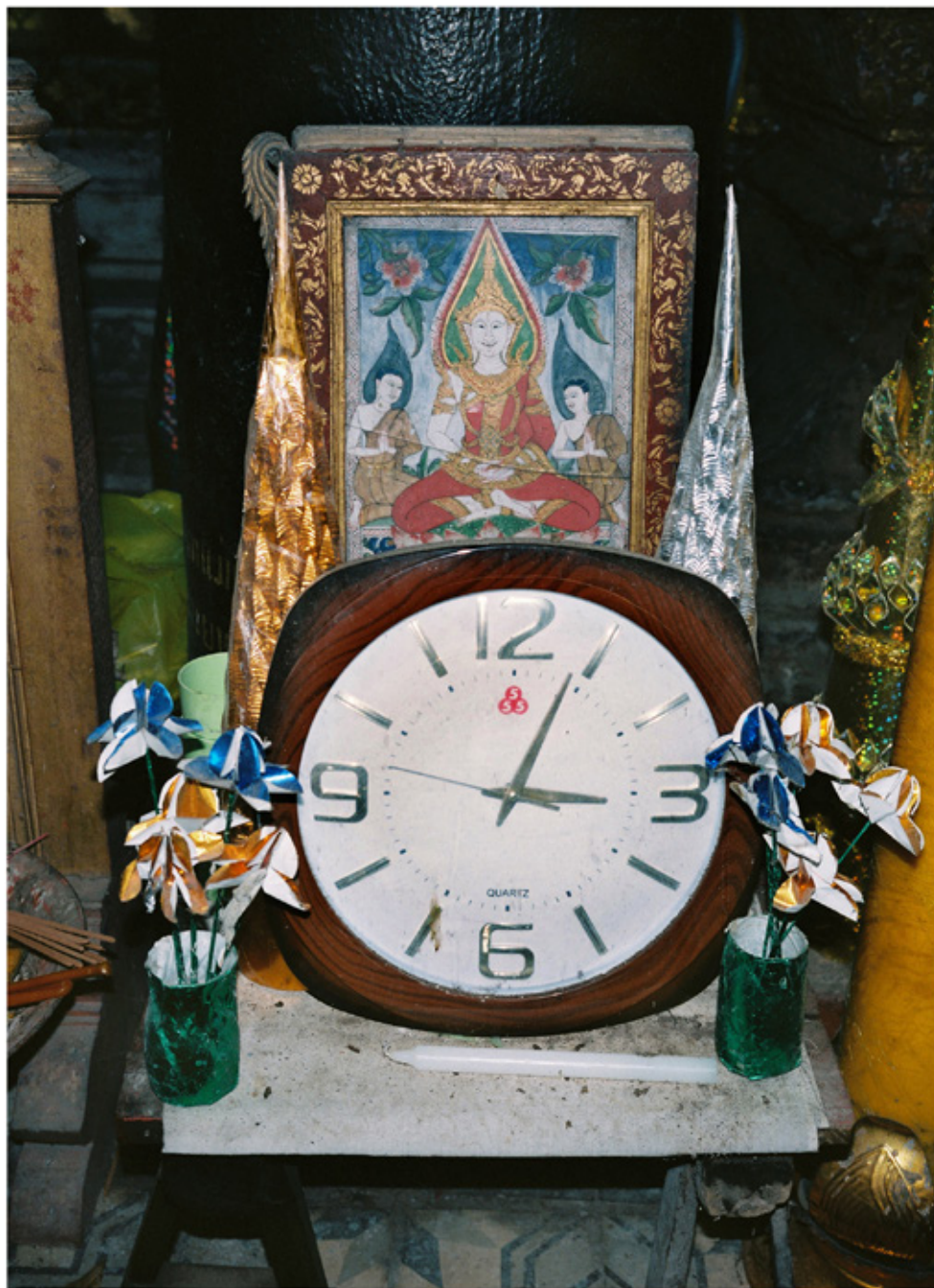
Offrandes, temple bouddhiste, Luang Prabang.