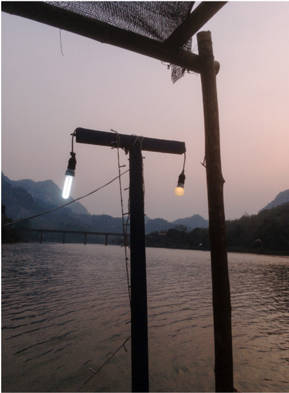
Nong Khiaw sur la Nam Ou. Le réseau électrique est précaire et l'électricité est très souvent coupée par intermittence en soirée.