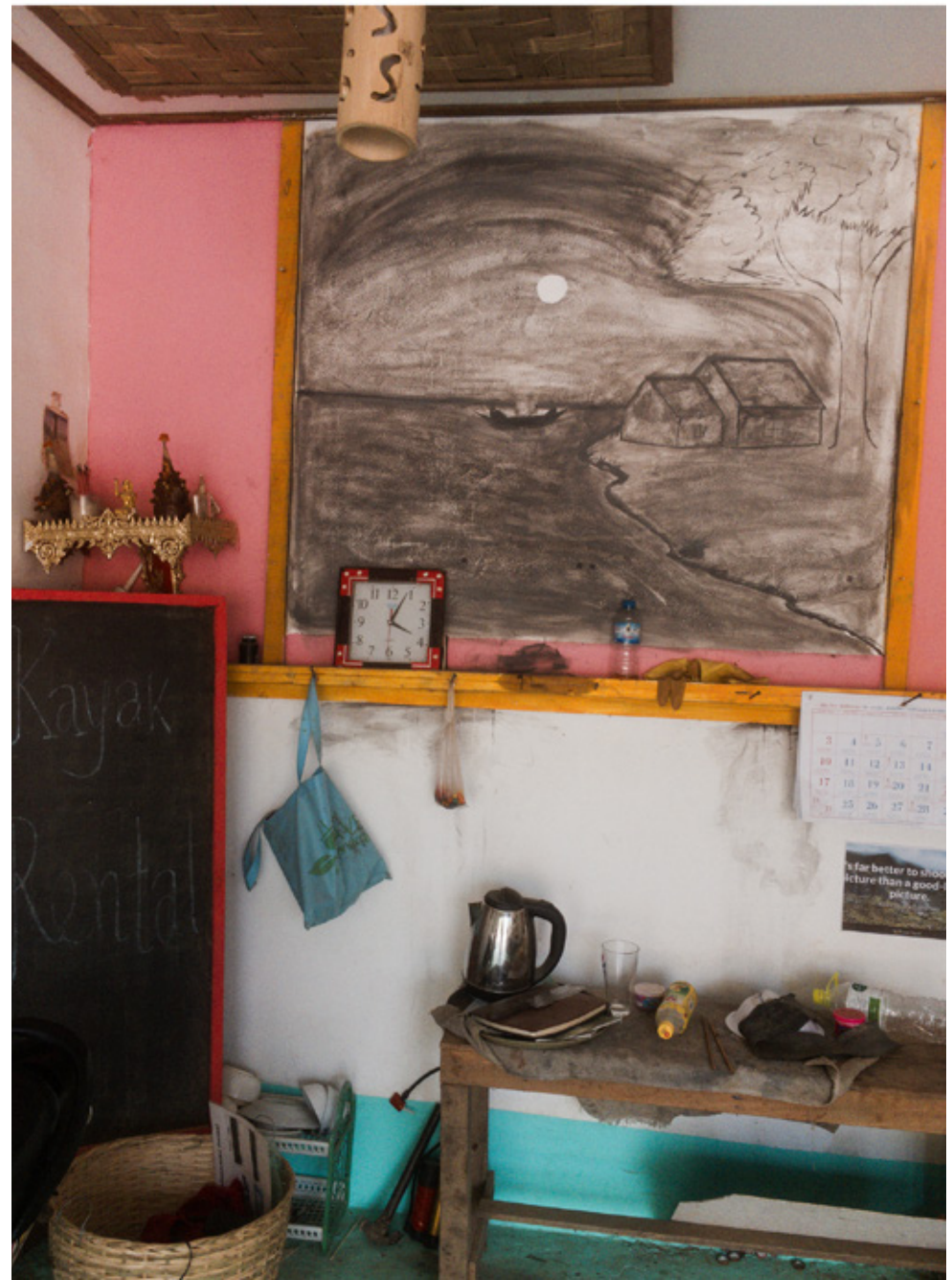
Nong Khiaw, petit village situé au nord du Laos, niché en plein cœur des montagnes karstiques et bordé par la rivière Nam Ou. Une de ressources principales aujourd'hui est le tourisme. Ici échoppe

pour location de Kayaks, de motos et organisation de randonnées dans la jungle et les villages qui bordent la Nam Ou.