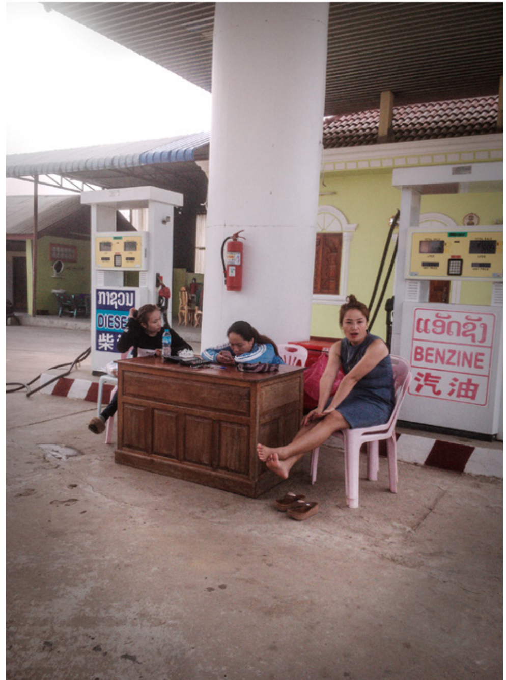
la route nationale 13 qualifié d'auto-route mais qui est une deux voix parfois bien dégradée, est un axe routier essentiel qui remonte à la frontière Laos-Chine.