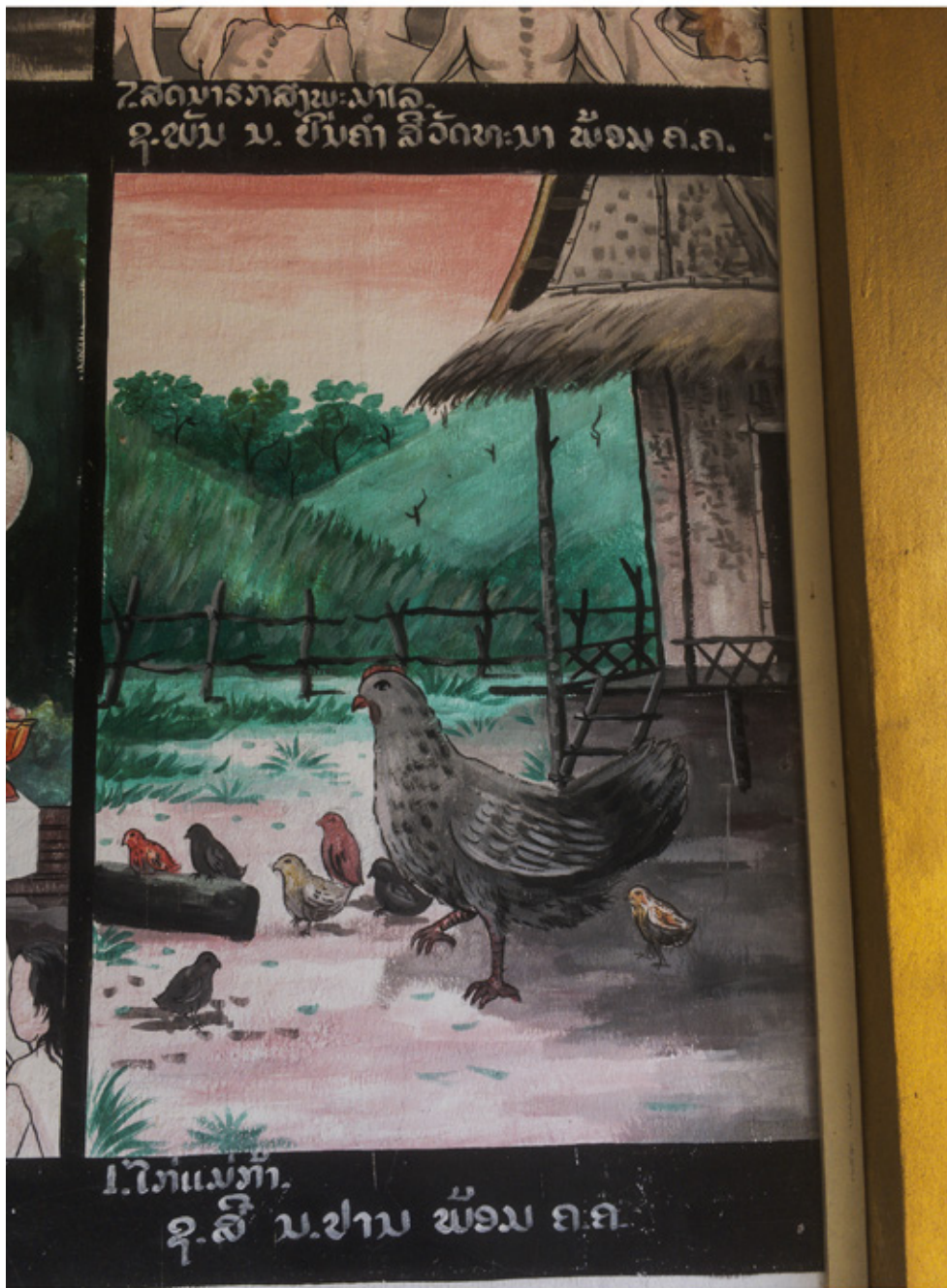
Les étapes de la vie de Bouddha, fresques du Wat Long Sakkalin, Luang Prabang.