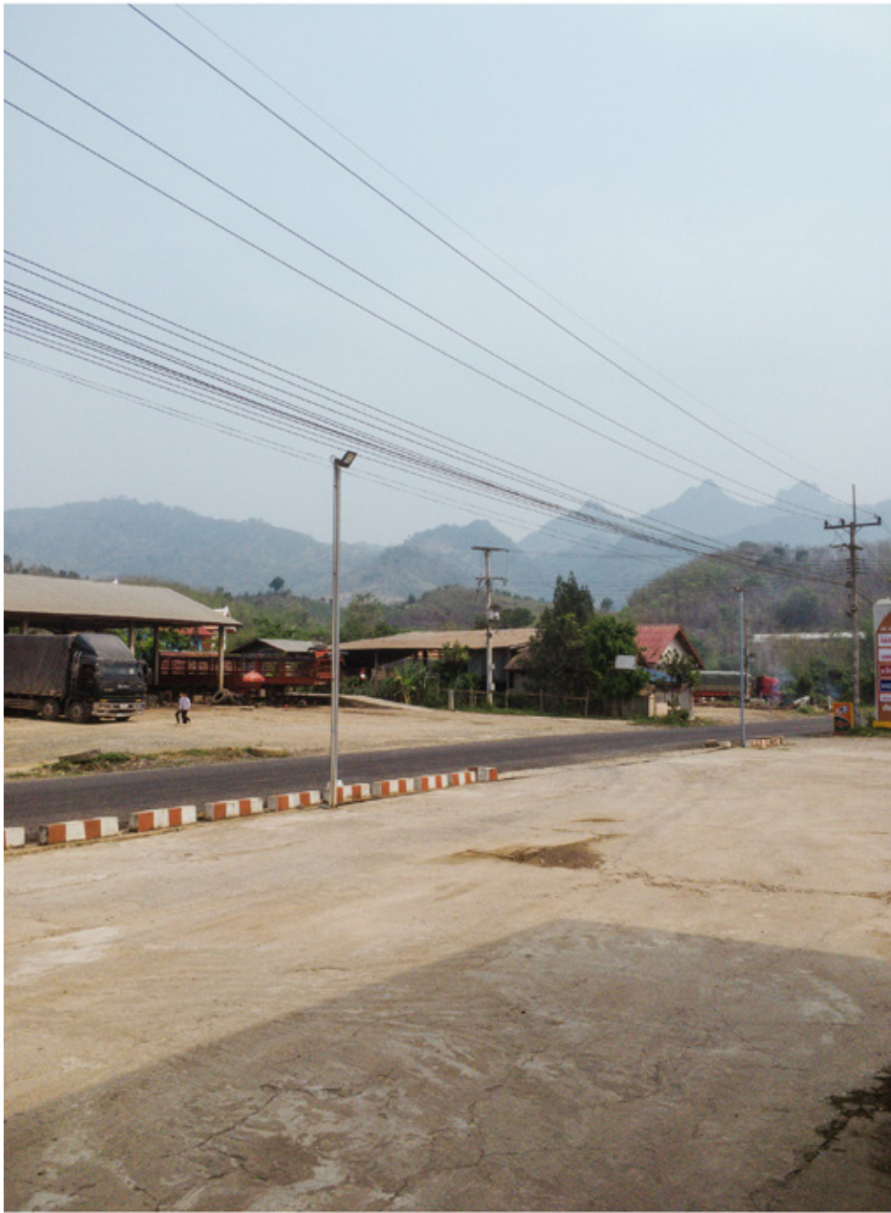
La Nationale 13 qui remonte vers le Nord du Laos le long de La Nam Ou. La construction de barrages rend maintenant impossible sa remontée fluviale depuis Luang Prabang.