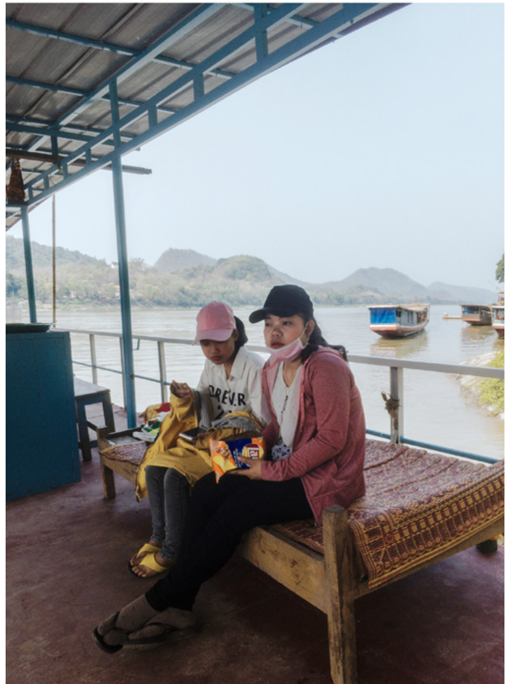
Bac sur le Mékong à Luang Prabang. Fin de journée de travail et retour dans un des villages de l'autre côté du fleuve.