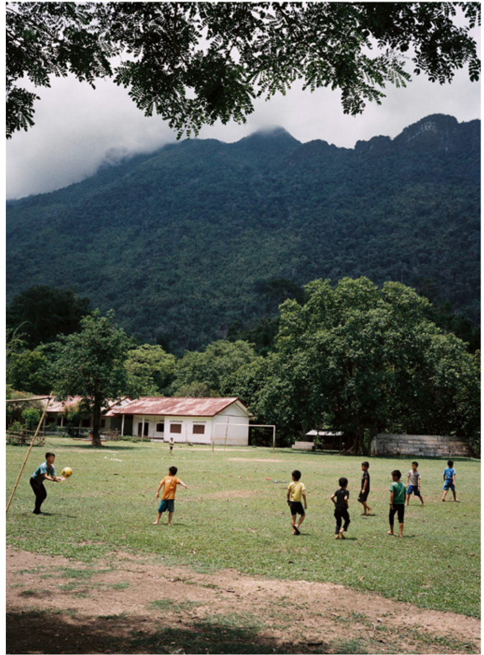
Le Laos compte 6,8 millions d'habitants, sa densité est la plus faible de toute l'Asie du sud-Est. Avec son âge médian de 20,3 ans, la population lao est la plus jeune de l'Asie du Sud-Est.