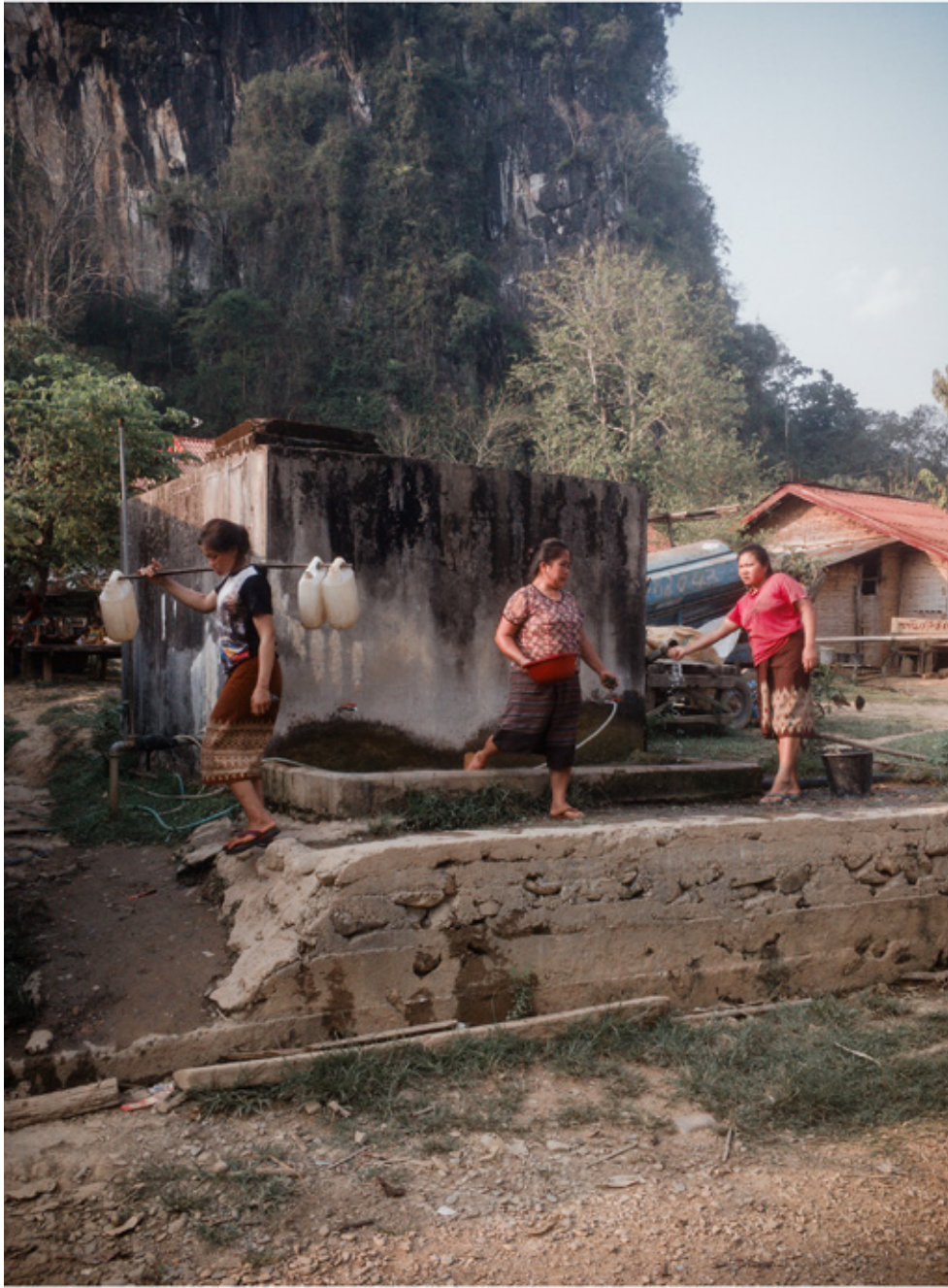
Le village Ban Na.