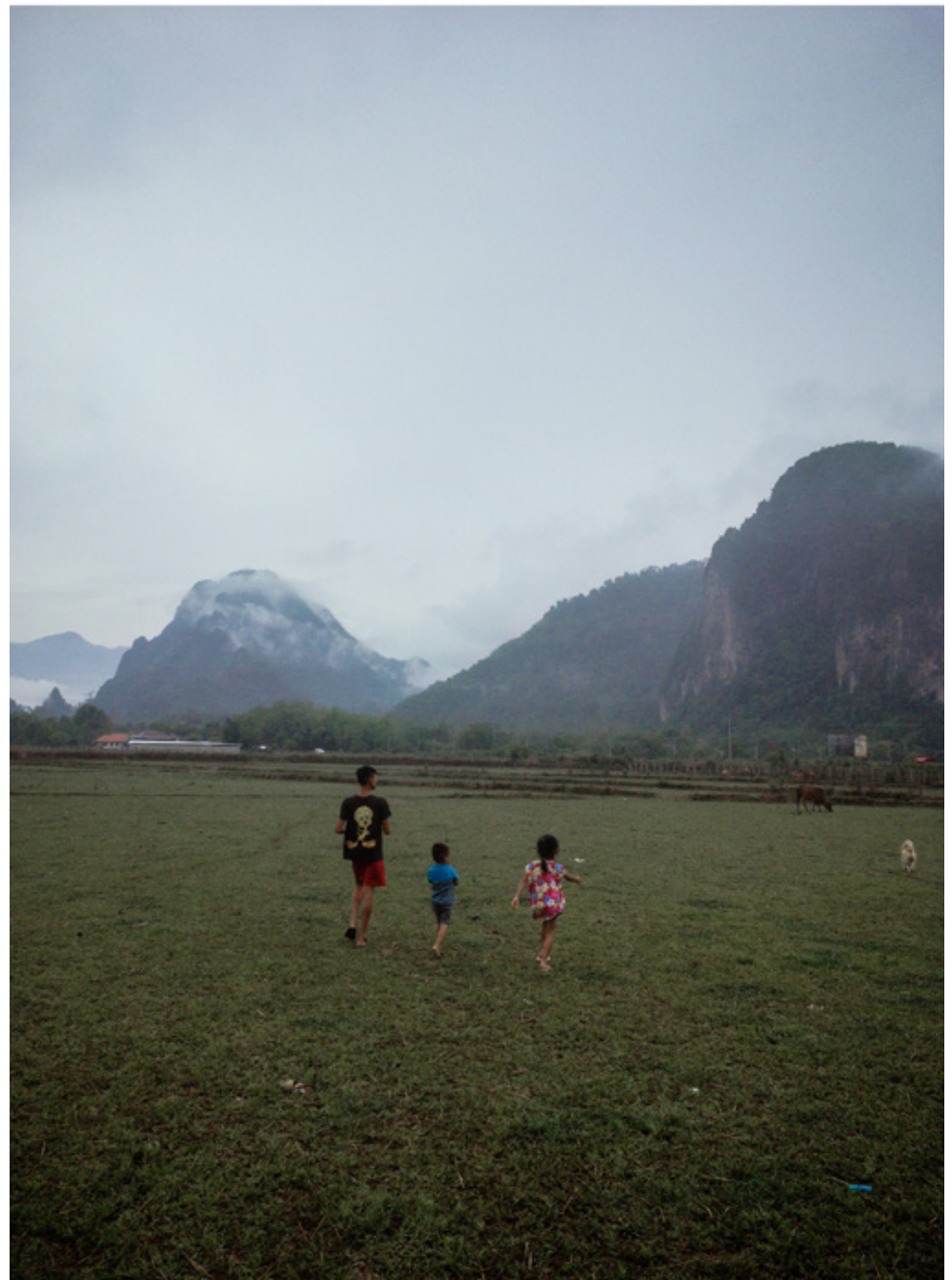
Au nord du Laos. Rizières à la saison sèche.