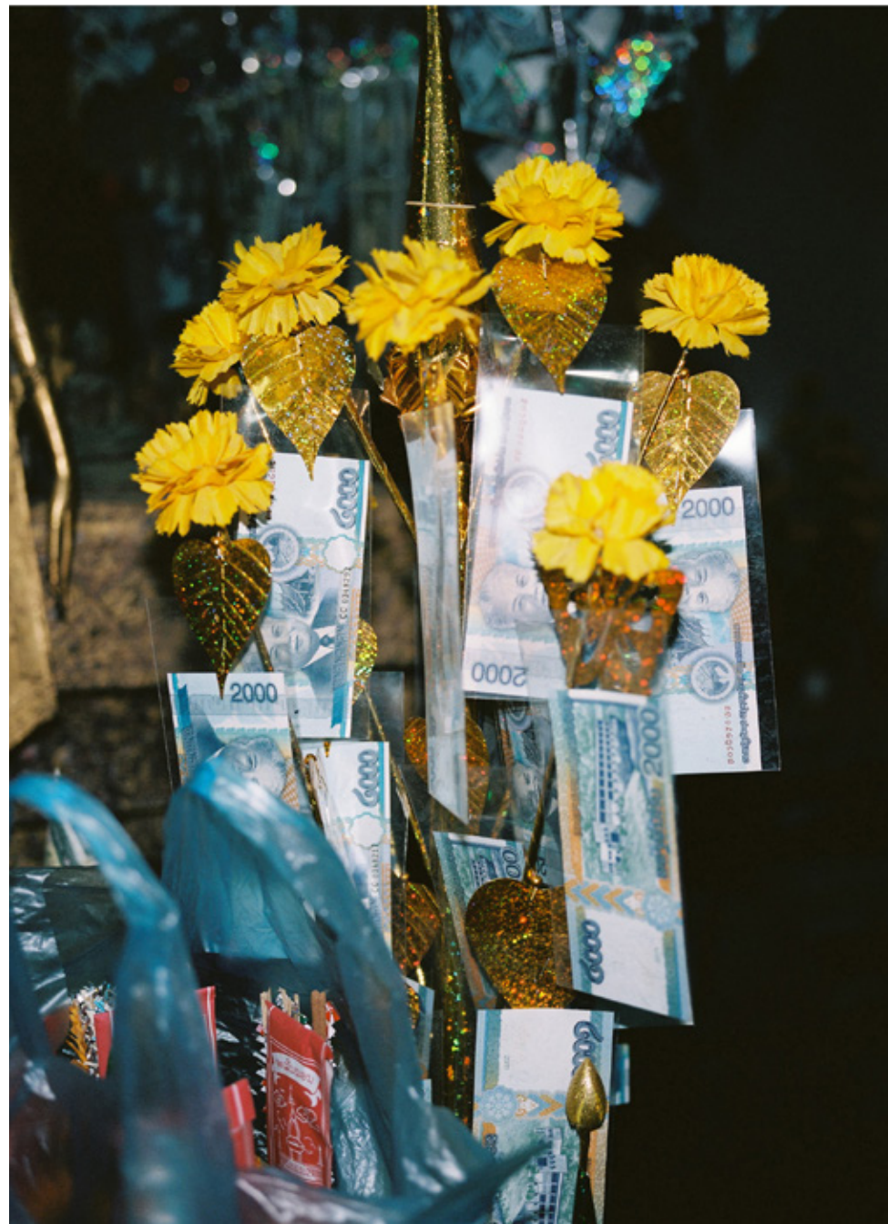
Offrandes, temple bouddhiste, Luang Prabang. l'argent n'est pas que matériel mais a aussi une dimension spirituelle, en tant que présage d'un bon karma.