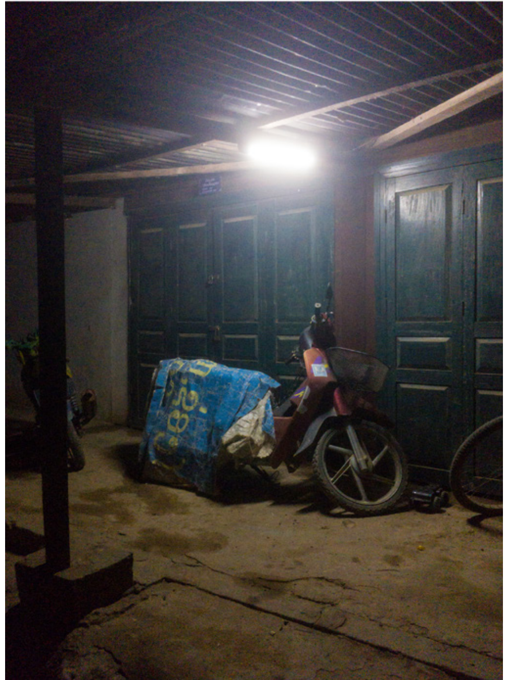
Le Laos exporte 70 % ( en 2015) de sa production électrique en direction de la Thaïlande, du Vietnam, et du Cambodge. Nombreux sont les petits villages qui ont été raccordés que depuis peu au réseau électrique, et les plus isolés vivent encore au rythme de la vie rurale traditionnelle.