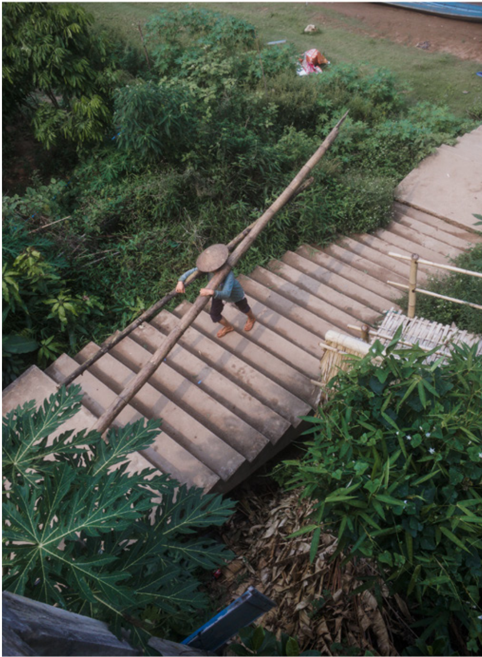
Embarcadère de Muang Ngoy sur le Nam Ou. Paysan déchargeant des bambous transportés en pirogue. Aucune route ne dessert le village, les transports se font par voie d'eau.