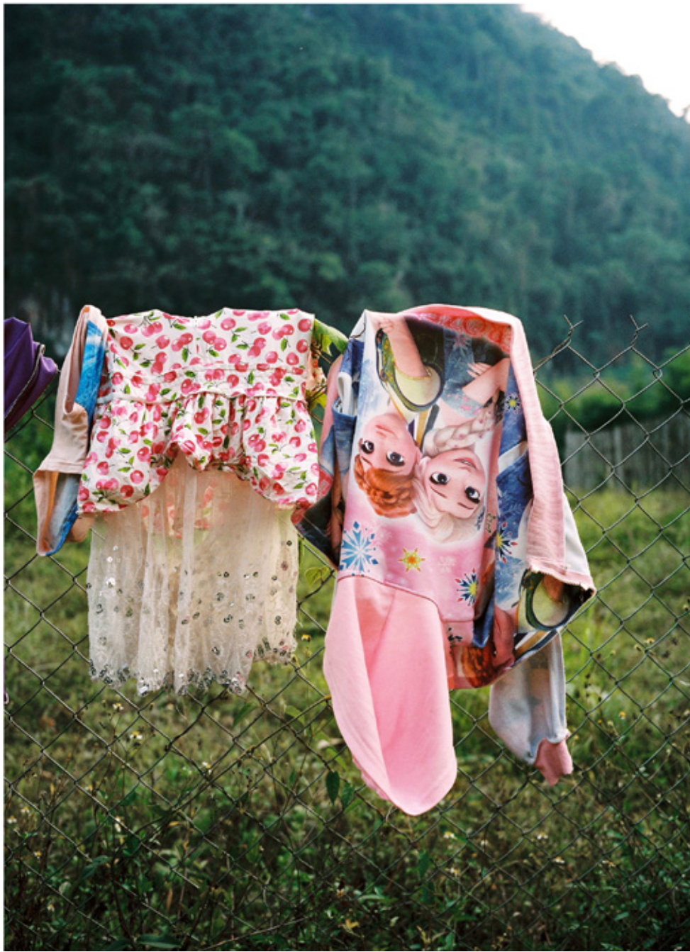
à Nong Khiaw sur la Nam Ou.