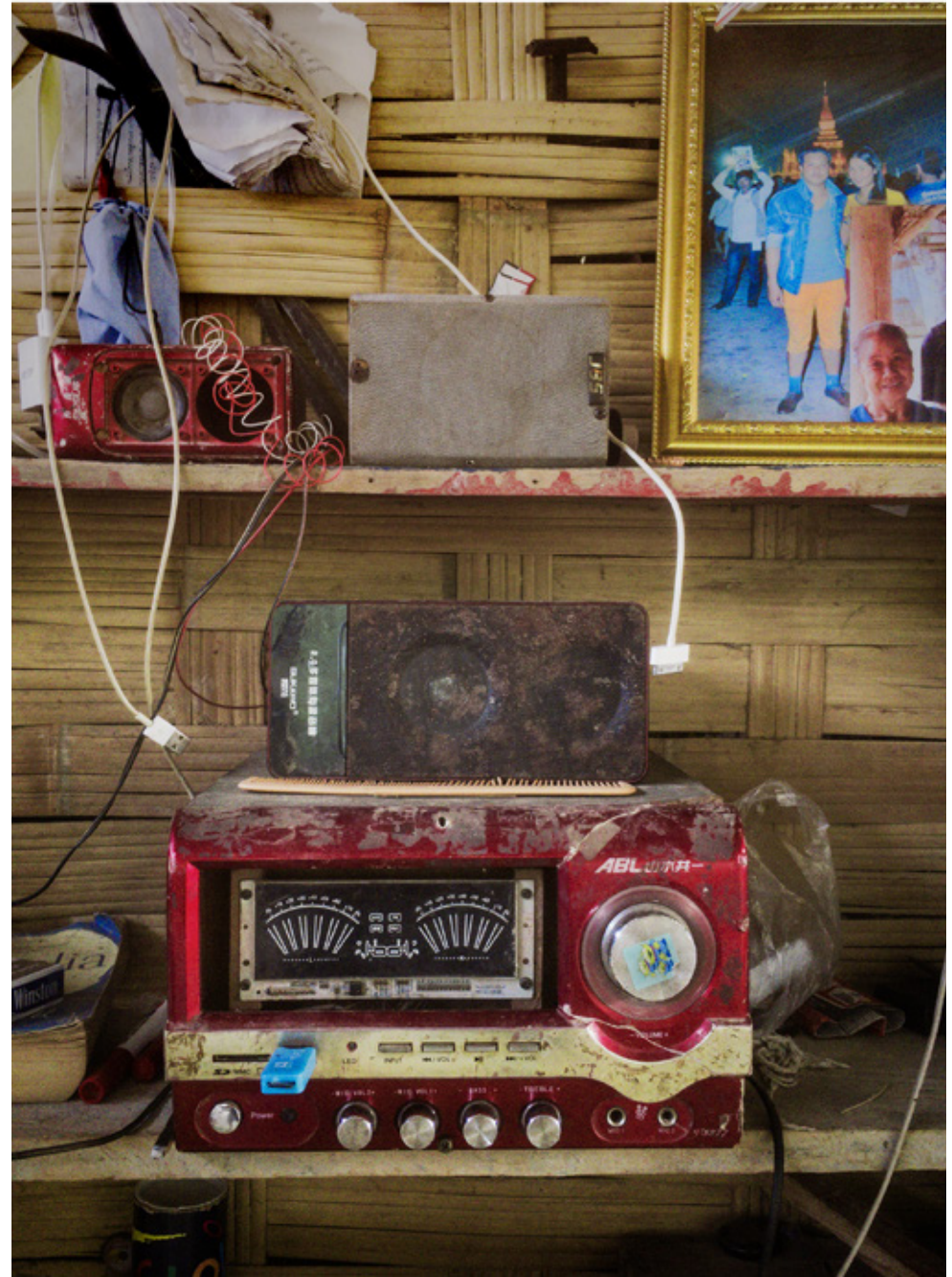
le village de Ban Na situé a quelques km de La nam Ou n'a pas l'électricité, comme beaucoup de villages. Monsieur Tong a développé parallèlement à son travail de paysan une toute petite activité touristique

avec la location d'un bungalow. Il a bricolé dans la rivière une toute petite dynamo, suffisante pour allumer quelques ampoules en passant par ce transformateur. Il n'a pas les moyens d'acheter un panneau solaire.