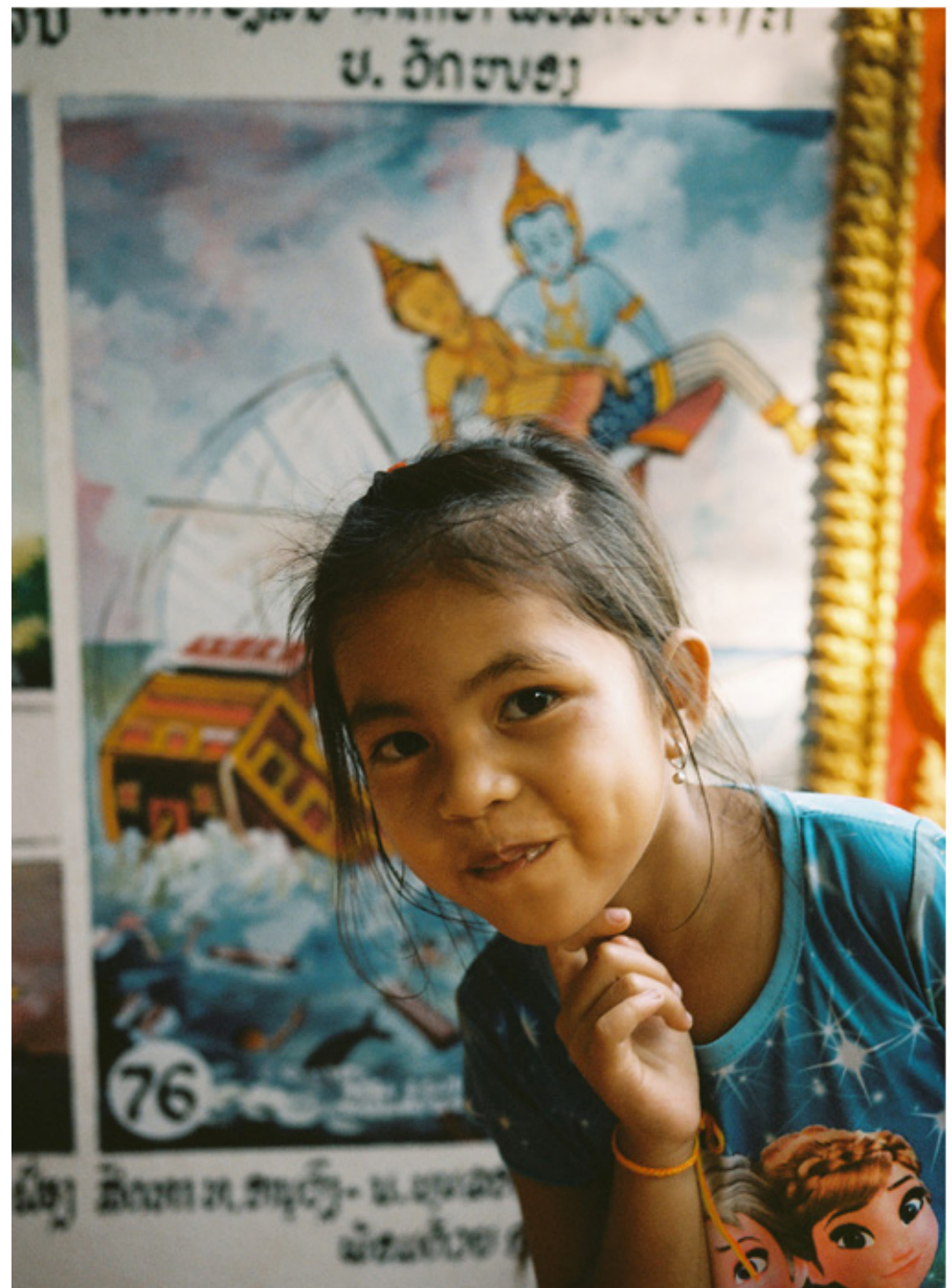
Les étapes de la vie de Bouddha, fresques du Wat Long Sakkalin, Luang Prabang.